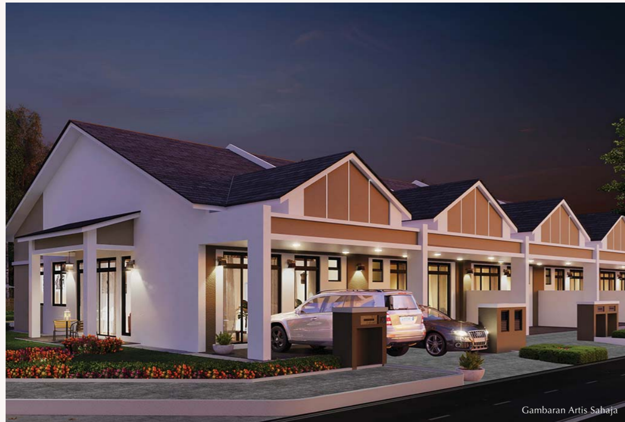
Gambaran Artis Sahaja