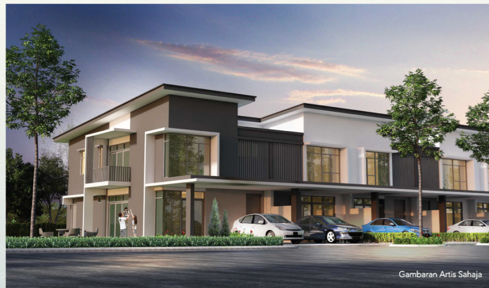
Gambaran Artis Sahaja

Tanjong Puteri Resort (TPR) adalah pembangunan perbandaran bertemakan resort pinggir bandar oleh Keck Seng Group yang merangkumi kira-kira 2,100 ekar dan terletak 2km dari Tanjong Puteri Golf Resort dan berdekatan Selat Johor. Miliki kediaman yang premium dengan harga yang berpatutan di Tanjong Puteri Resort yang mempunyai akses mudah ke Pusat Bandar Johor Bahru melalui Lebuhraya JB East Coast dan ke Pengerang melalui Ekspres Senai-Desaru yang baru dinaik taraf. Terletak di lokasi yang strategik dan dikeliling dengan segala prasarana seperti Hospital Pakar Daerah, Politeknik Ibrahim Sultan, Litar Johor, Hospital Pakar Pasir Gudang dan Pasaraya Tesco.